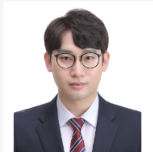
상표 : 윤신우 변리사 (현장강의에 한해 제공)