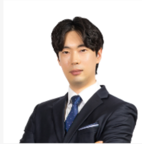
특허 : 조현중 변리사 (현장/온라인강의 제공)