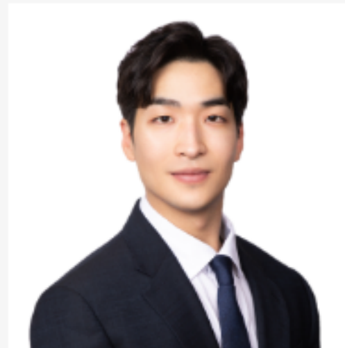
저작권법 : 이한결 변리사 (현장강의에 한해 제공)