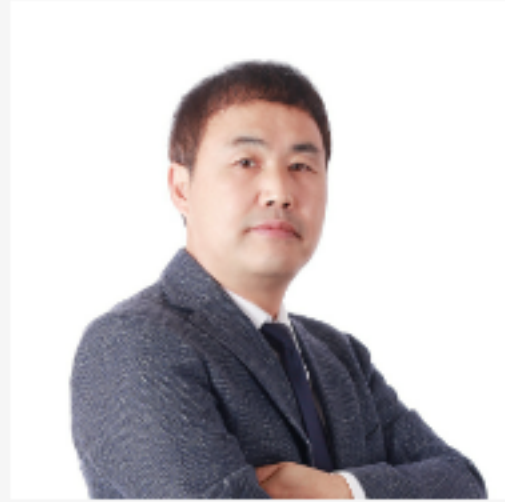
민사소송법 : 최영덕 박사 (현장/온라인강의 제공)